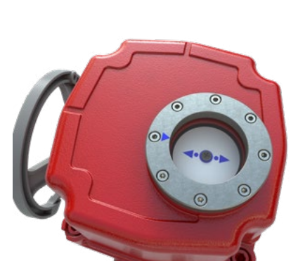
Figure 1: Tailles 1 à 4, et taille 6.