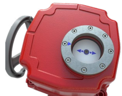
Figura 1: Tamanhos 1-4 e Tamanho 6.